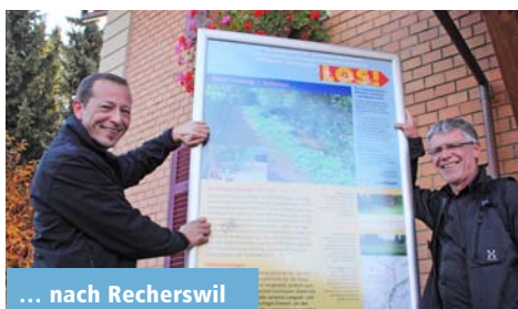
... nach Recherswil