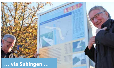
... via Subingen ...